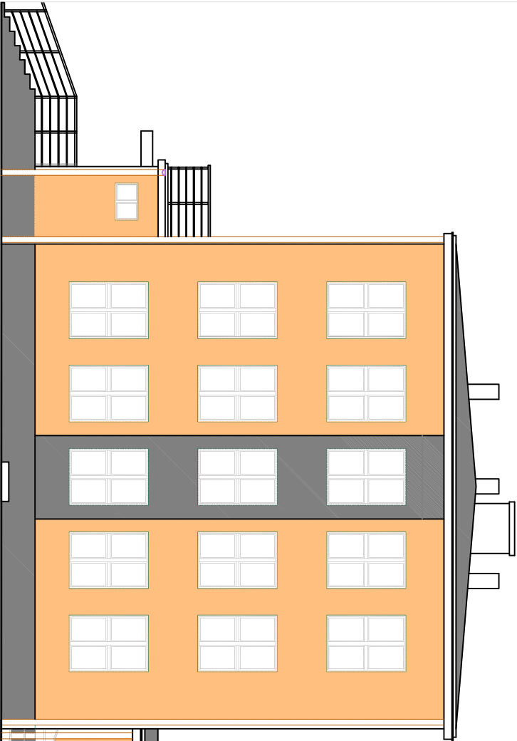
ELEWACJA ZACHODNIA skala 1:100

KOLORY ŚCIAN PONAD COKŁEM: - beż 31336 67C1 - wejście główne oraz pasy w szczytach - szary 37301 15C1 KOLOR COKŁU: - szary